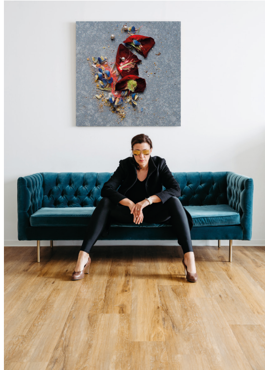
Eva Katharina Günther Atelier EKG, Köln, 2021